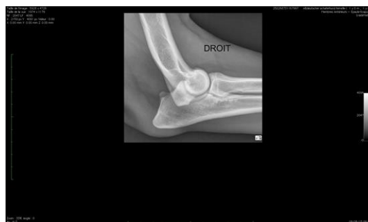
Radiographie officielle de dépistage de dysplasie du coude droit (extension)