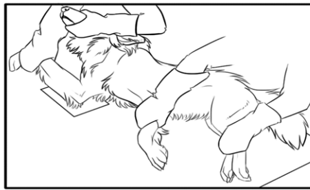
Position du chien lors du dépistage de dysplasie des coudes (flexion)