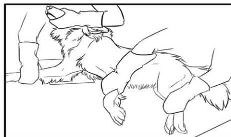
Position du chien lors du dépistage de dysplasie des coudes (extension)